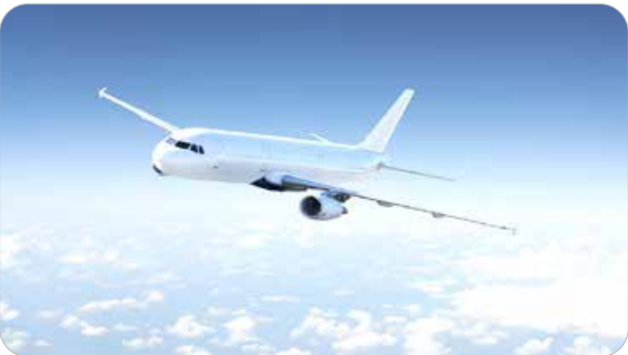
پرواز هواپیمای ایرانی به مقصد تهران

مگر و میر ناشی از کرونا در ایران پروتهای خارجی به ایران نیز کاهش و یا قطع شد. اما اکنون معاون هوانوردی سازمان هواپیمایی کشور می‌گوید: راپزنی برای آغاز پروازهای لوفت‌هانزا را انجام داده‌ایم و به زودی نتیجه آن را اعلام می‌کنیم. ابولقاسم جلالی معاون هوانوردی سازمان هواپیمایی کشور با بیان اینکه طبق جلسات این طریق ترس کرونایی از هواپیما کاهش یابد. آنتی بحران خطوط هوایی تاثیر مستقیمی بر عرضه و تقاضای سفر خواهد گذاشت و شرایط فعالیت و بازگشت بسیاری از شرکت‌ها را فراهم می‌کند و همچنین تقاضای سفر برای گردشگران یاتوجه به اعتمادسازی صورت گرفته افزایش می‌یابد که این امر می‌تواند تاثیر مثبتی هم بر صنعت هوایی جهان و هم بر بازار گردشگری بگذارد و منجر به بازیابی این دو بازار درآمدا و خروج از رکود بی‌سابقه شود.