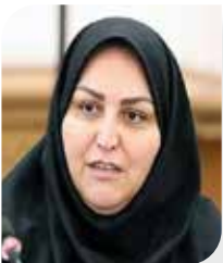
نمایندگان مجلس شورای اسلامی ساز و کار

تکمیل طرح های نیمه تمام و آماده بهره برداری و در حال بهره برداری را در سسال ۱۴۰۰ تعیین کردند. به گزارش اقتصادسراسرآمد، نمایندگان مجلس شورای اسلامی در جلسه علنی مجلس و در جریان بررسی بخش درآمدی لایحه بودجه سال ۱۴۰۰، ردیف ۳ و بند الحاقی ۱ در تبصره ۱۹ ماده واحده لایحه بودجه را بررسی کرده و آن را به تصویب رساندند. بر اساس بند الحاقی به تبصره ۱۹ ماده واحده لایحه، به دولت اجازه داده می شود در اجرای ماده(۲۷) قانون الحاق برخی مواد به قانون تنظیم بخشی از مقررات مالی دولت(۲) از محل منابع بودجه و دارائی های خود، تمهیدات لازم را برای اجرای طرح های نیمه تمام و آماده بهره برداری و در حال بهره برداری، اعم از طرح های تملک دارائی های سرمایه ای یا منابع عمومی و اختصاصی و طرح های شرکت های دولتی با منابع داخلی از طریق انعقاد قرارداد در قالب ماده مذکور با بخش های خصوصی، تعاونی و شهر دارها، دهیاری ها، با اولویت بخش های خصوصی و تعاونی فراهم کند.