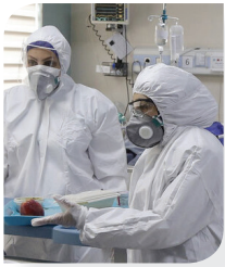
دو پرستار در بیمارستان تهران

به گزارش اتاق بازرگانی ایران، دیپلماسی فعال بخش خصوصی در بحران کرونا تا اینجای کار توانسته است موافقت حداکثری نهادهای تجاری بین‌المللی را کسب کند. رئیس اتاق ایران در نامه‌هایی جداگانه در رئیس اتاق بازرگانی بین‌المللی (ICC) و رئیس انجمن اتاق‌های بازرگانی و صنعت اروپا (Eurochambres)، همراهی این دو نهاد برای رفع محدودیت‌های تحریم علیه ایران را خواستار شده بود؛ چراکه این محدودیت‌ها مستقیماً مبارزه با کرونا در ایران را مختل کرده‌است.