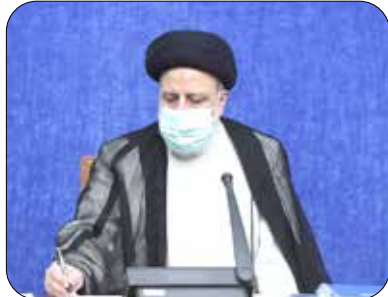
رئیس‌جمهور گفت: تعطیلات هرزه نباید وقفه‌ای در خدمت‌رسانی و انجام وظایف