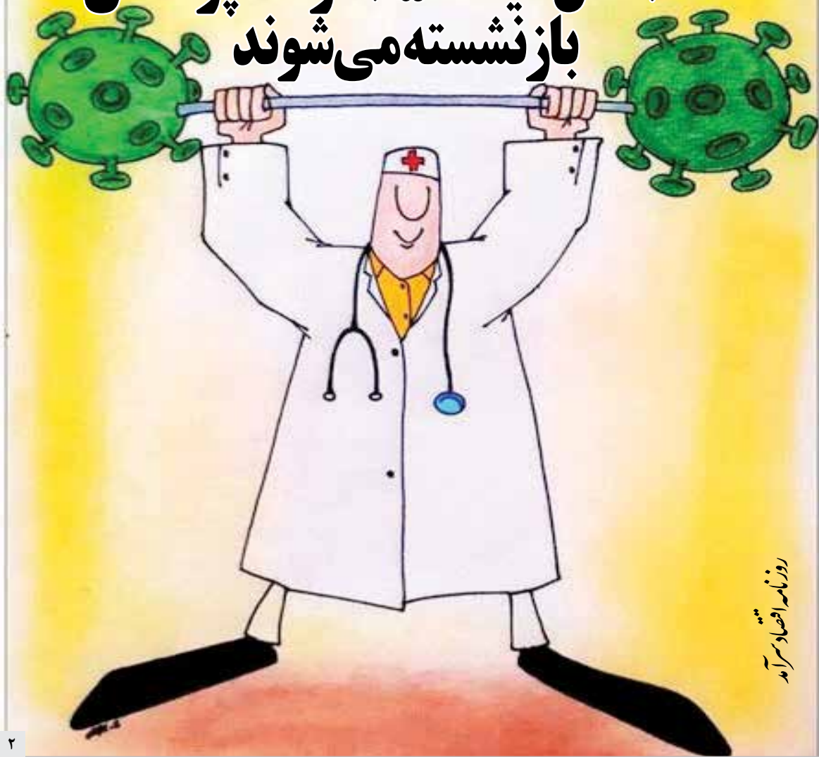
روزنامه اقتصاد سراسرآمد

بررسی «اقتصادسراسرآمد» از شامخ ساختمان در نظر سنجی اتاق تعاون ایران