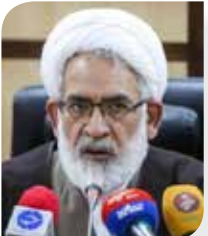
گروه جامعه – اگر بخواهیم واقع بینانه نگاه کنیم خطر موج پنجم کرونا هنوز ادامه دارد و هر لحظه امکان ورود به

موج ششم نیز وجود دارد لذا عادی نگاری ها و عدم رعایت دستورالعمل های بهداشتی زنگ خطری جدی برای اوج گیری کرونا محسوب می شود. به گزارش اقتصادسراسرآمد، در رابطه با وضعیت انسفار کرونایی کشورمان تسنیم با ارایه گزارشی نوشت:موج پنجم شیوع کرونا، یکی از هولناک ترین موج هایی بود که از ابتدای شیوع کرونا تجربه کردیم و در حال حاضر نیز در اوج شیوع این بیماری قرار گرفته ایم و علت اصلی آن هم عادی انگاری مردم و بی تفاوتی آن ها نسبت به رعایت دستورالعمل های بهداشتی است، اما با وجود کاهش اندک شمار مبتلایان در چند روز اخیر، ثبت رکوردهای مربوط به تعداد بیماران بستری شده و مرگ و میر ناشی از کرونا در برخی استان ها نشان می دهد کشور هنوز از بحران پیک پنجم کرونا خارج نشده است.