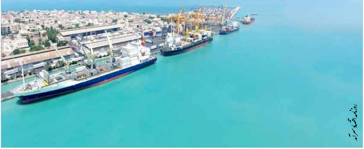
روزنامه اقتصاد سرآمد