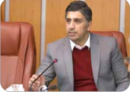
رویداد کار آفرین