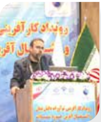
رویداد کار آفرین

رئیس سازمان شیلات ایران از اعلام آمادگی ۱۸۰ شرکت دانش پایه برای فعالیت در بخش شیلات خبر داد.به گزارش اقتصادسراسرآمد، سیدحسین حسینی گفت: ۱۸۰ شرکت دانش بنیان در حوزه شیلات اعلام آمادگی کردند که ۴۸ شرکت با برنامه تحول وزارت جهاد کشاورزی تطابق داشتند.به گفته سیدحسین حسینی تسهیلات ارزان قیمت در اختیار شرکت های دانش بنیان قرار می گیرد تا بتوانند دستاوردهای خود را تجاری سازی کنند. محورهای این رویداد شامل : تکثیر و پرورش آبزیان (ماهیان، سخت پوستان، نرم تنان، گیاهان آبزی، جلبک ها و ...)، پرورش ماهیان دریایی در قفس، ماهیگیری، ارزبایی و مدیریت ذخایر، تکنولوژی و روش های صید، حفاظت از منابع، فرآوری، بسته بندی و اقتصاد چرخشی آبزیان، فناوری های نوین (نانو تکنولوژی، بیوتکنولوژی و ...) در حوزه شیلات، تجارت و صادرات آبزیان، تولید و تجارت ماهیان زینتی، تغذیه، بهداشت و صنایع جانبی، گردشگری شیلاتی، فرآورده های آرایشی، بهداشتی، دارویی قابل استحصال از آبزیان می باشد.