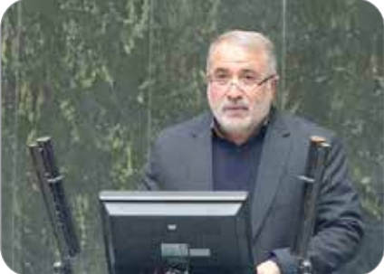
رویداد کار آفرین