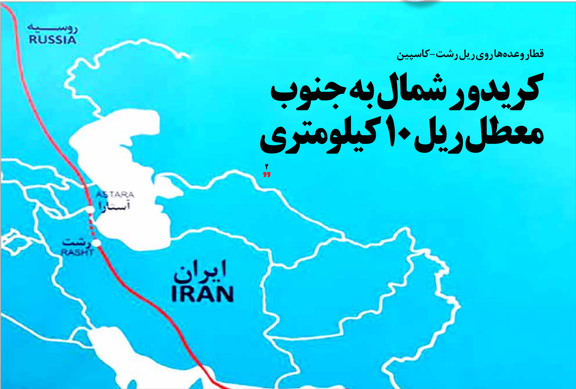
قطار وعده‌ها روی ریل رشت-کاسپین

قطر که یکی از بزرگترین صادرکنندگان ال‌ان‌جی در جهان و دومین تأمین‌کننده بزرگ این سوخت برای اروپاست، اوایل هفته جاری، سه کشتی حامل ال‌ان‌جی را از مسیر دریای سرخ خارج کرد و مسیر کشتی‌ها را به سمت دماغه امید نیک در جنوب آفریقا به اروپا تغییر داد. کشتی‌های حامل ال‌ان‌جی قطر و روسیه، از دریای سرخ عبور می‌کردند تا اینکه درگیری‌ها در اواخر هفته گذشته تشدید شد. بر اساس گزارش بلومبرگ، در حالی که سفرهای طولانی‌تر باعث محدود شدن کشتی‌های ال‌ان‌جی موجود و افزایش هزینه‌های حمل‌ونقل می‌شود، با توجه به ذخایر بسالا و تقاضای صنعتی پایین در اروپا، انتظار نمی‌رود به کمبود آن در اروپا منجر شود. داده‌های سازمان ICIS نشان می‌دهد، انتقال ال‌ان‌جی از قطر به انگلیس از طریق جنوب آفریقا، حدود ۲۷ روز طول می‌کشد، در حالی که مدت سفر از مسیر کانال سوئز، ۱۸ روز است.