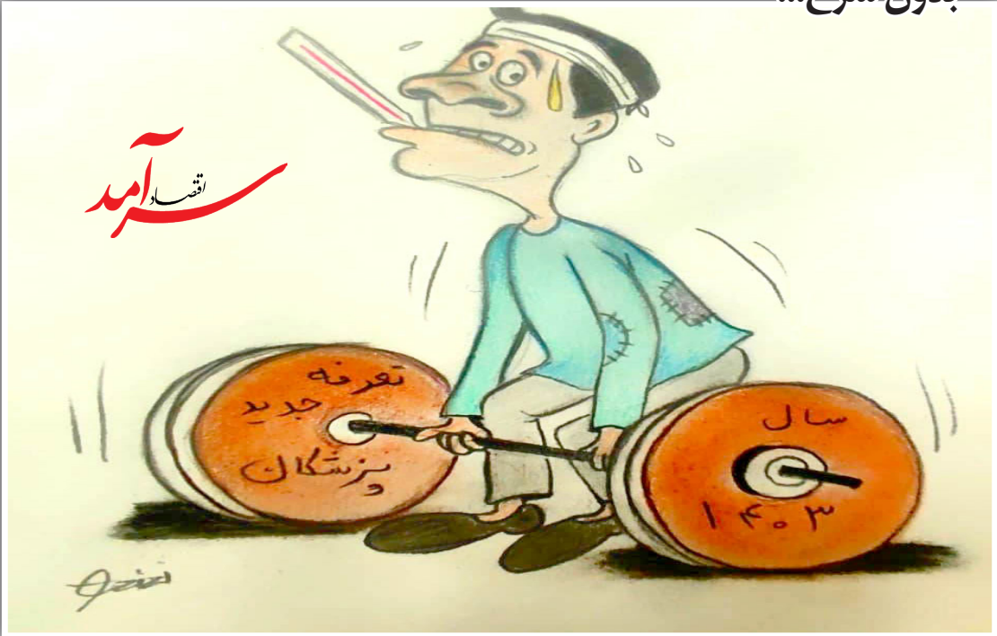
فریابازی - اقتصاد سرآمد