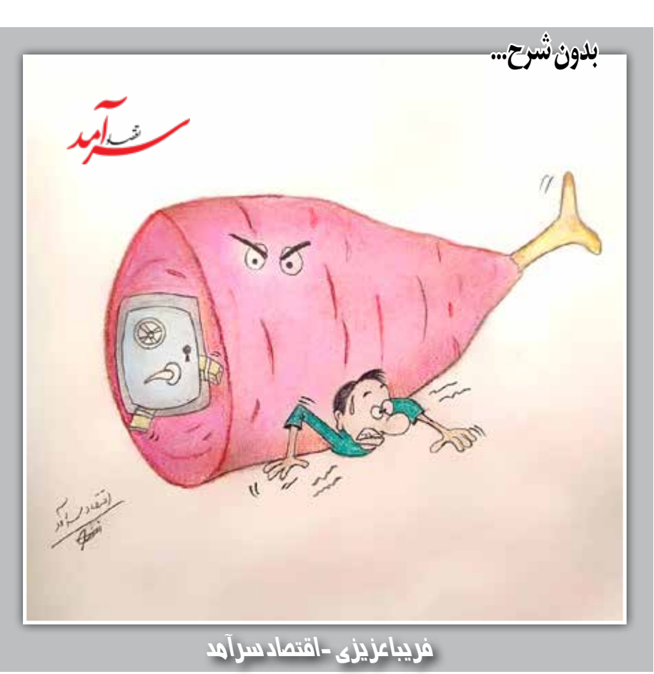
فریداعیزی -اقتصاد سراسرآمد

اهمیت زنگزور برای آمریکا چیست؟ پیشنهاد ایالات متحده برای اجاره ۱۰۰ساله کریدور زنگزور، نشان‌دهنده اهمیت راهبردی این کریدور برای تضعیف محور روسیه- ایران-چین و تأمین امنیت انرژی اتحادیه اروپا با کاهش وابستگی به مسکو است. در طول تاریخ، منطقه قفقاز جنوبی همواره میدان رقابت قدرت‌های منطقه مانند روسیه، ایران و عثمانی بوده است. پس از فروپاشی شوروی