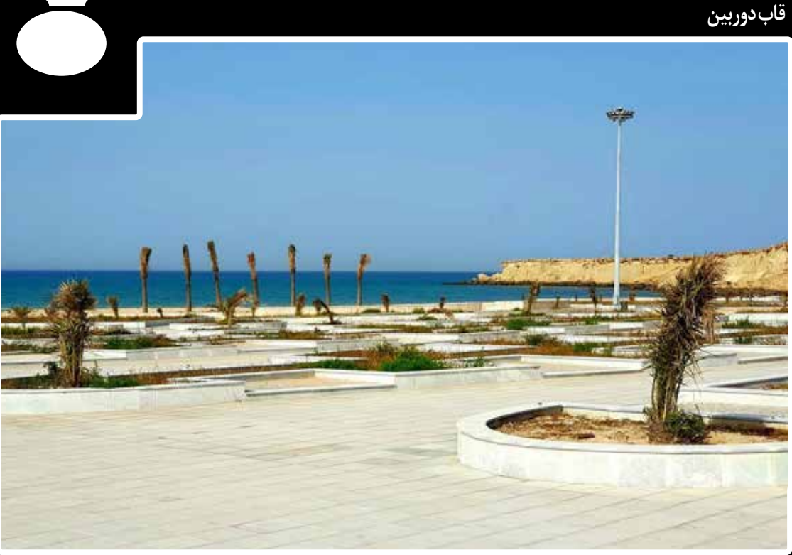
عکس: اصغر بشارتی