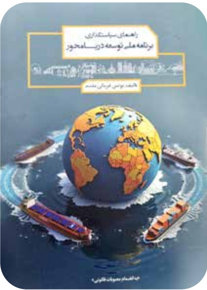
کتاب راهنمای سیاست‌گذاری برنامه ملی توسعه دریامحور

در شرایطی که سهم اقتصاد دریامحور از تولید