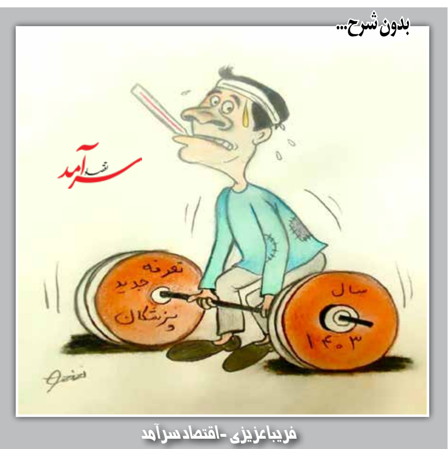
فریداعیزی -اقتصاد سراسر آمد

تنگه هرمز امنیت عبور و مرور در بحران تحریم‌ها تنگه هرمز، به‌عنوان یکی از حساس‌ترین گره‌های جغرافیایی-سیاسی جهان، همواره در قلب تعاملات انرژی و امنیتی بین‌الملل قرار داشته است. اما امروز، با تشدید تنش‌های سیاسی و تحمیل تحریم‌های گسترده، این تنگه نه‌تنها به مسیری برای عبور نفت و گاز تبدیل نشده، بلکه به نمادی از ناپایداری ساختاری در منطقه تبدیل شده است. تحریم‌ها، علاوه بر محدود کردن ظرفیت‌های اقتصادی و فنی ایران، تأثیر مستقیمی به توانایی این کشور در حفظ نظارت و کنترل امنیتی بر این مسیر ایجاد کرده‌اند. افزایش هزینه‌های نگهداری نیروهای حفاظت، کاهش همکاری‌های فنی با شرکت‌های بین‌المللی در زمینه ناوبری و نظارت بر ترافیک، و محدودیت در دسترسی به فناوری‌های روز دستگاه‌های راداری و ماهواره‌ای، همگی از جمله پیامدهای غیرمستقیم این تحریم‌ها بر امنیت تنگه هرمز هستند. در نتیجه، امنیت این مسیر، که قبلاً بیشتر بر اساس توانایی‌های داخلی و همکاری‌های استراتژیک بنا بود، اکنون تحت تأثیر نااطمینانی‌های سیاسی و اقتصادی