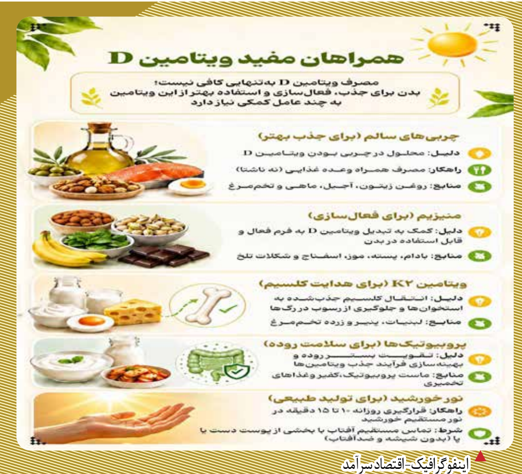
اینفوگرافیک- اقتصاد سراسرآمد