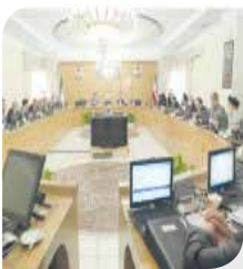
تصویر: نمای داخلی از ساختمان سازمان اسناد و کتابخانه ملی جمهوری اسلامی ایران

شهرآه سلاح پولی آمریکا به مجموعه‌های فزاینده تحریم‌های ثانویه بانکی آمریکا، تسلیحاتی است که برای اعمال تحریم‌ها اطلاق می‌شود که ایران در سلب‌های اخیر یکی از مهمترین اهداف آن بوده‌است. به گزارش اقتصاد سرآمد، سلاح پولی آمریکا، به مجموعه هماهنگ قوانین تحریم‌های ثانویه بانکی آمریکا، توصیه‌های FATF و خدمات سوئیفت برای اعمال تحریم‌ها اطلاق می‌شود که با تکیه بر قدرت ارز چهارنوا‌ی دلار و سیطره این ارز بر مبادلات جهانی، در پی تحقق بخشی به سلطه آمریکا بر جهان است. ایران از مهمترین اهداف این سلاح در سال‌های اخیر بوده‌است.