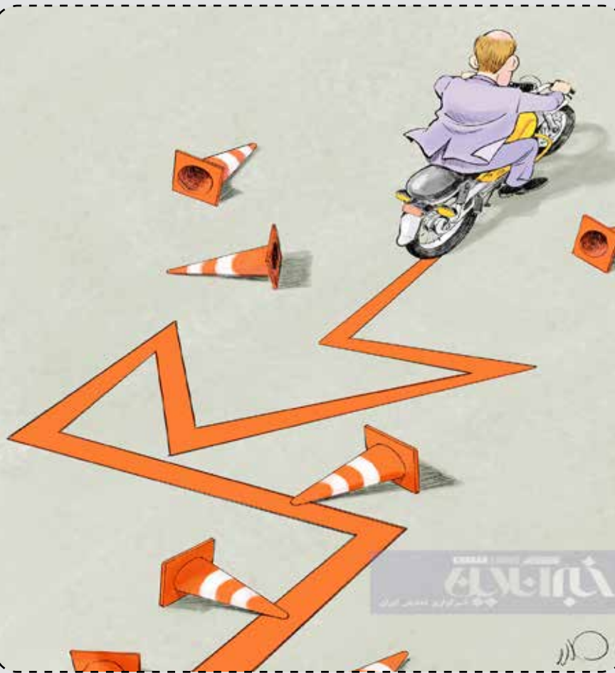
جدیدترین شیرین‌کاری موتورسواران ایرانی!