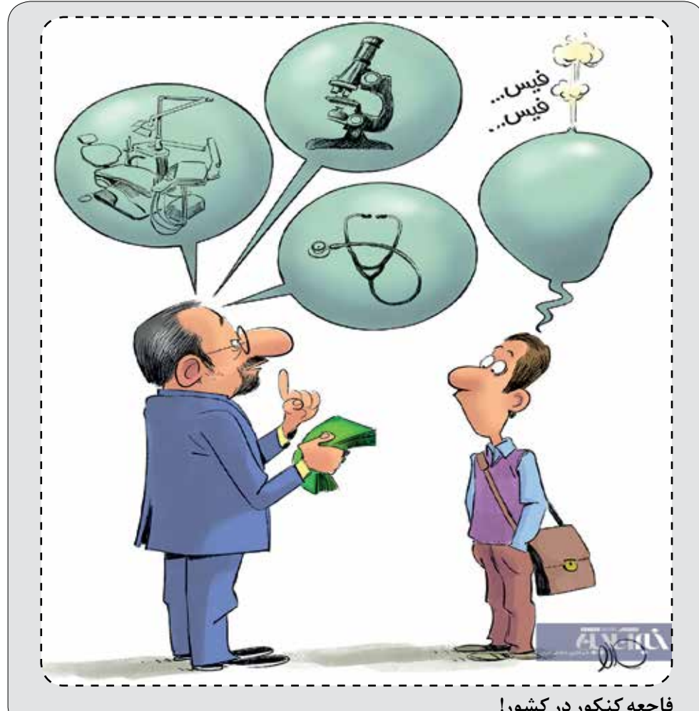
فاجعه کنکور در کشور!