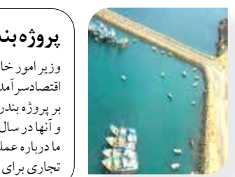
وزیر امور خارجه هند طی سخنانی در مجلس نمایندگان این کشور گفت، تحریم‌های آمریکا ارتباطی با پروژه بندر چابهار در ایران ندارد و این بندر در حال فعالیت است.به گزارش اقتصادسراسر آمد از ایندین کسپرس، "اس جایشانکار" وزیر امور خارجه هند به "لوک سابها"(اعضای مجلس نمایندگان) گفت که تحریم‌های آمریکا علیه ایران تأثیری بر پروژه بندر چابهار هند در ایران نداشته است.وی در پاسخ به سوال "ریش پاندی" عضو حزب "بی‌اس پی" BSPخاطر نشان کرد که دو افتاقنامه در سال ۲۰۱۶ امضا شده است و آنها در سال ۲۰۱۸ پایانه را در اختیار گرفته اند. جایشانکار افزود: تا کنون ۶ جرتقیل تأمین کرده‌ایم و پایانه بطور کامل عملیاتی شده است.وی همچنین گفت: تمام توافق‌نامه‌های ما درباره عملیات در بندر چابهار به ایران محدود می‌باشد و بندر در حال فعالیت است. وزیر خارجه هندوستان در ادامه تأکید کرد که بندر چابهار ایران به عنوان یک هاب ترانزیت تجاری برای منطقه ظاهر شده و یک مسیر باثبات و اقتصادی تر برای کشورهای محصور در خشکی برای رسیدن به هند و بازار جهانی است.

نسل جدید شناورهای تندرو عاشورا در سال‌های بعد و با پیگیری راهبرد بکارگیری قایق‌های تندرو در ندسا، رفته رفته شناورهای جدیدتر با طراحی‌های بروزتر و متناسب با تهدیدات جدی به نیروی دریایی سپاه تحویل شد. این شناورهای جدید که طراحی بدنه آنها نسبت به قایق‌های عاشورا تفاوت‌های بسیاری پیدا کرده است علاوه بر آنکه توانایی نصب تسلیحات متنوع با بردهای مختلف به آنها افزوده شده است، با تجهیز به پیشران‌های جدید به سرعت‌های بالایی