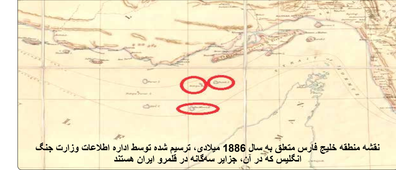
نقشه منطقه خلیج فارس متعلق به سال 1886 میلادی، ترسیم شده توسط اداره اطلاعات وزارت جنگ انگلیس که در آن، جزایر سه گانه در قلمرو ایران هستند

سرلشکر سید عبدالرحیم موسوی فرمانده کل ارتش روزهای گذشته در جمع معاونان اطلاعات